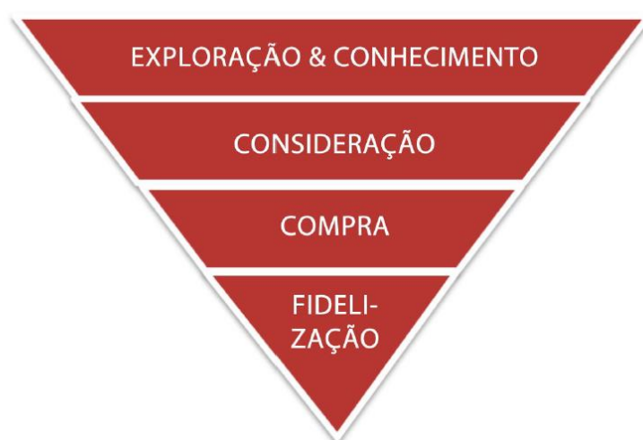
Figura 3 – Funil de Conversão

Compreender os pensamentos e comportamentos dos clientes é um grande desafio, por isso sua empresa precisa considerar o comportamento do consumidor em sua estratégia de marketing . Para tal objetivo devemos utilizar o Funil de Conversão, termo utilizado para definir o processo pelo qual um usuário se vincula com uma marca ou produto. Para obter o melhor resultado no funil de conversão é importante saber em que etapa o usuário está: a etapa vai variando ao longo do nível de vinculação com