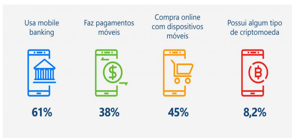
Figura 1 – Dinheiro Conectado

Com o surgimento de novos hábitos dos consumidores, se busca compreender as influências que constantemente se alteram quando se trata do poder de comunicação e informação, o marketing digital, ou seja, o marketing no ambiente digital se tornou uma ferramenta poderosa para tal evolução, e está mudando a maneira como as pessoas se relacionam com o mercado, produtos e marcas. “A mudança no comportamento do consumidor estimulou o investimento em marketing digital que tem previsão de crescimento de 12% ao ano até 2021” (IAB, 2017. s.p.).