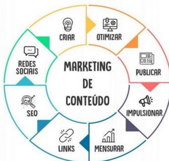
Figura 4 – Marketing de Conteúdo

Para tal escalonamento, atualmente tem-se uma vasta gama de recursos e ferramentas que devem ser consideradas em seus projetos ou ações de marketing , tais como: E-mail Marketing , Links Patrocinados , SEO , Mídias Sociais , Análise de Sites , Pop-Ups e WhatsApp Business , que aplicadas juntamente com um bom planejamento estratégico, podem fazer total diferença.