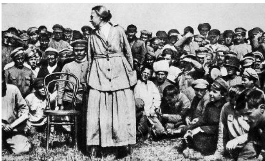
Figura 2 – Nadezhda Krupskaya emancipando militares e camponeses

O modelo pedagógico socialista, foi implantado após a Revolução Russa de 1917, com ideias do professor ucraniano Makarenko e a educadora revolucionária Nadezhda Krupskaya, que propôs uma educação baseada na emancipação social, substituindo à escola burguesa por um perfil mais populista, implementando a prevalência da coletividade e valorização do trabalho integrado. Essa pedagogia foi o alicerce primordial para a reforma brusca que URSS aplicou na Rússia e os países satélites do então bloco econômico da época.